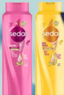
ACO/SHAMPOO SEDAL 650ml

Pcio.x kg/l: 9999,85 Cod: 12236-12238-20739-25390-