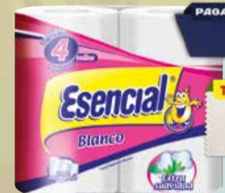
PAPEL HIGIENICO ESENCIAL blanco 4x30mts Pcio.x kg/l: 10,42 Cod: 13689