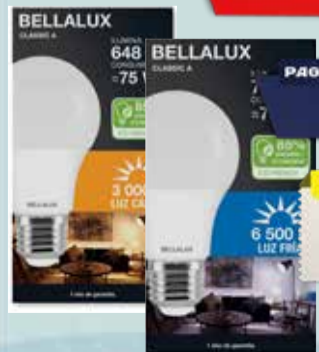
LAMPARA LED BELLALUX 9W Pcio.x kg/l: Cod: 28885-28886

Y ADEMAS TE DEVOLVEMOS 165,80 EN MAXI VOUCHER