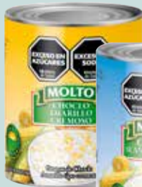
CHOCLO MOLTO CREMA BCA-AMAR X 300 Grs Pcio.x kg/l: 2433,00 Cod: 25206-19781

Y ADEMÁS TE DEVOLVEMOS 219,98 EN MAXI VOUCHER