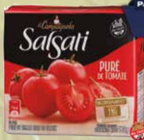
PURE DE TOMATES SALSATI X 520 GR Pcio.x kg/l: 2115,19 Cod: 14082