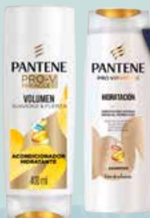
SHAMPOO/ACOND PANTENE 400ml

Pcio.x kg/l: 13749,75 Cod: 26952-12225-15331-4805-