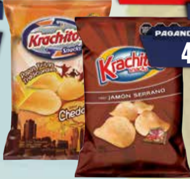
PAP. FR. KRACHITOS CHED - JAM. SER. 330 gr Pcio.x kg/l: 15757,27 Cod: 21181-12931