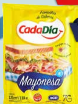
MAYONESA CADA DIA SACHET X 125 Grs Pcio.x kg/l: 2559,20 Cod: 7183