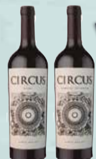
VINO CIRCUS VARIETALES x750cc Pcio.x kg/l: 4399,87 Cod: 15321-15320