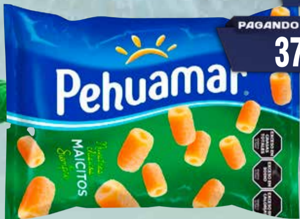
MAICITO SNACK PEHUAMAR X 265 GR Pcio.x kg/l: 15093,96 Cod: 4313