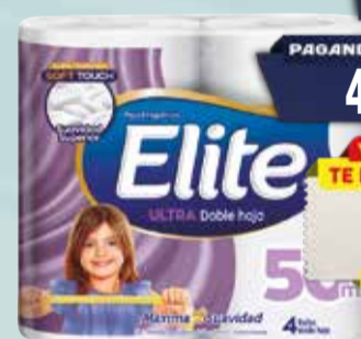
PAPEL HIGIENICO ELITE DH SOFT 4x50mts Pcio.x kg/l: 23,50 Cod: 14952