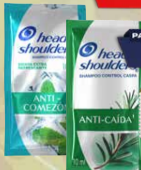
SHAMPOO H&S SACHET 10ml