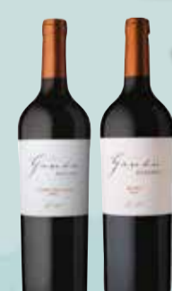
VINO FLIA. GASC. RESREVA VAR. X 750 cc Pcio.x kg/l: 6666,53 Cod: 22609-22608