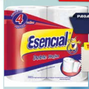
PAPEL HIGIENICO ESENCIAL DH 4x20mts Pcio.x kg/l: 17,50 Cod: 23622