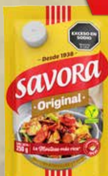
MOSTAZA SAVORA x 250 gr. Pcio.x kg/l: 4799,60 Cod: 11565