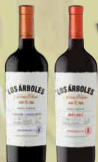
VINO LOS ARBOLES VAR. X 750 cc Pcio.x kg/l: 4399,87 Cod: 14390-14391