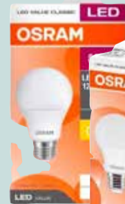
LAMPARA LED OSRAM/LEDVANCE 12W Pcio.x kg/l: Cod: 22705-22706

Y ADEMAS TE DEVOLVEMOS 319,80 EN MAXI VOUCHER