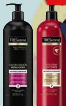
ACO/SHAMPOO TRESEMME 880ml

Pcio.x kg/l: 13636,25 Cod: 14638-14643-16178-14631-