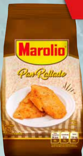
PAN RALLADO REBOZADOR MAROLIO x 1 kg. Pcio.x kg/l: 1199,90 Cod: 26973-26974