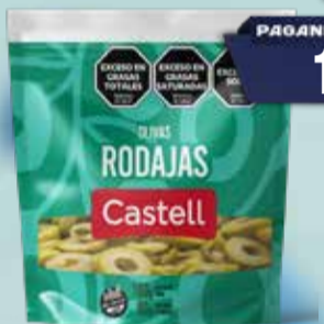
ACEITUNAS CASTELL VER. ROD D/P 80 gr Pcio.x kg/l: 13748,75 Cod: 27689