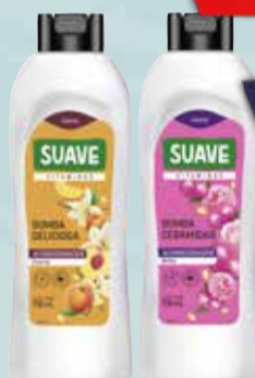
SHAMPOO/ACO SUAVE 930ml

Pcio.x kg/l: 3225,70 Cod: 24617-24619-20138-18599-