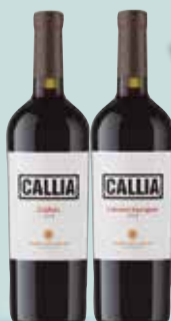
VINO CALLIA VARIETALES x750cc Pcio.x kg/l: 4666,53 Cod: 17460-17467-25269