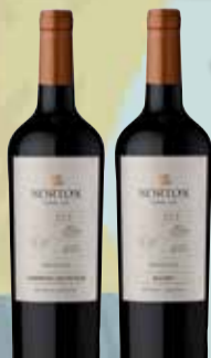
VINO NORTON BAR. SELECT VAR. x 750 cc Pcio.x kg/l: 6666,53 Cod: 13956-21487