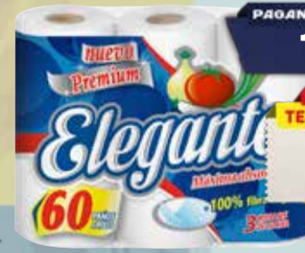
ROLLO COCINA ELEGANTE 3x60paños Pcio.x kg/l: 9,72 Cod: 28769