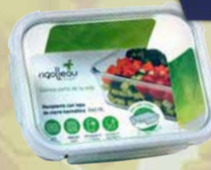
HERMETICO RIGOLLEAU VID.TERM 1060 ml Pcio.x kg/l: Cod: 28934