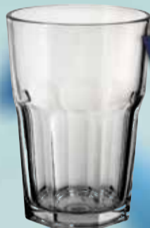
VASO RIGOLLEAU OSLO 400cc Pcio.x kg/l: 5371,07 Cod: 21012