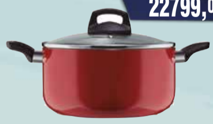
CACEROLA ILKO 24cm Pcio.x kg/l: Cod: 24822