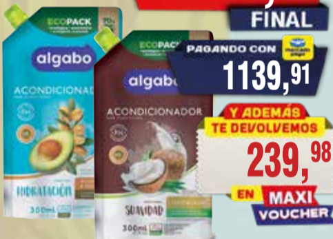
SHAMPOO Y ADONCIONADOR ALGABO D/P x 300 ml

Pcio.x kg/l: 3999,67 Cod: 25891-25889-25887-25886-