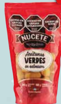
ACEITUNAS NUCETE VDE. N°5 120 gr Pcio.x kg/l: 11249,17 Cod: 5953