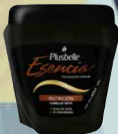
CREMA PARA PEINAR PLUSBELLE ESENC.NUTRI 400 ml