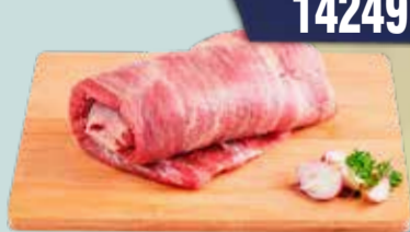
MATAMBRE TF CARNES PORCIONADO X KG. Pcio.x kg/l: 14999,90 Cod: 28473