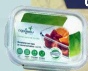
HERMETICO RIGOLLEAU VID.TERM 660 ml Pcio.x kg/l: Cod: 28936