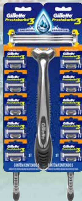
MAQUINA PRESTOBARBA 3 AZUL

Pcio.x kg/l: 13332,78 Cod: 24183-24182-25717-25718