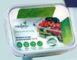
HERMETICO RIGOLLEAU VID.TERM 1510 ml Pcio.x kg/l: Cod: 28935