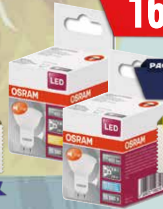
LAMPARA LEDVANCE GU10 5W Pcio.x kg/l: Cod: 27289-27290

Y ADEMAS TE DEVOLVEMOS 339,80 EN MAXI VOUCHER