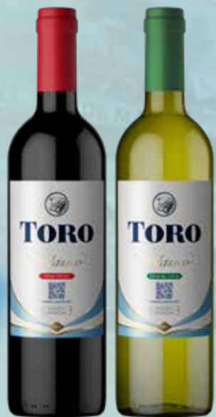
VINO TORO VIEJO TTO./BCO. x 750 CC Pcio.x kg/l: 2533,20 Cod: 2053-2052