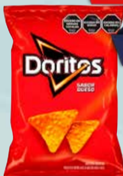
SNACK DORITOS QUESO X 200 GR Pcio.x kg/l: 29999,50 Cod: 16456