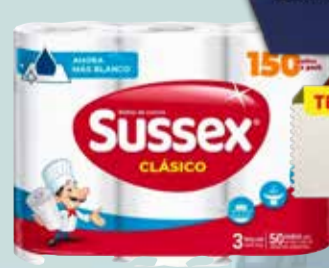
ROLLO COCINA SUSSEX 3x50paños Pcio.x kg/l: 10,00 Cod: 9334