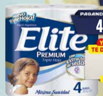
PAPEL HIGIENICO ELITE TH 4x30mts Pcio.x kg/l: 40,00 Cod: 17105