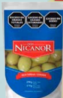
ACEITUNAS D. NICANOR VERDE D/P 170 gr Pcio.x kg/l: 7352,35 Cod: 27892