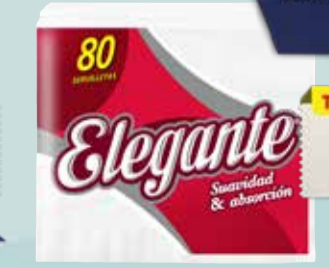
SERVILLETAS ELEGANTE 80u Pcio.x kg/l: 16,25 Cod: 50992