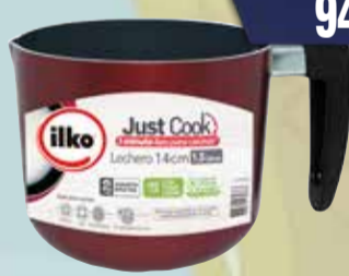
JARRO ILKO 14cm Pcio.x kg/l: Cod: 20390