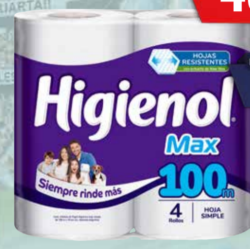
PAPEL HIGIENICO HIGIENOL MAX 4x100mts Pcio.x kg/l: 12,50 Cod: 1135