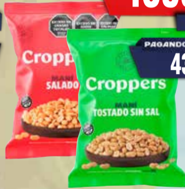
MANI CROPPERS SALADO-TOSTADO 800 gr Pcio.x kg/l: 5749,88 Cod: 23560-27955