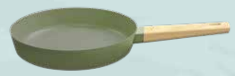
SARTEN HUDSON CERAMICA 24cm Pcio.x kg/l: Cod: 25412