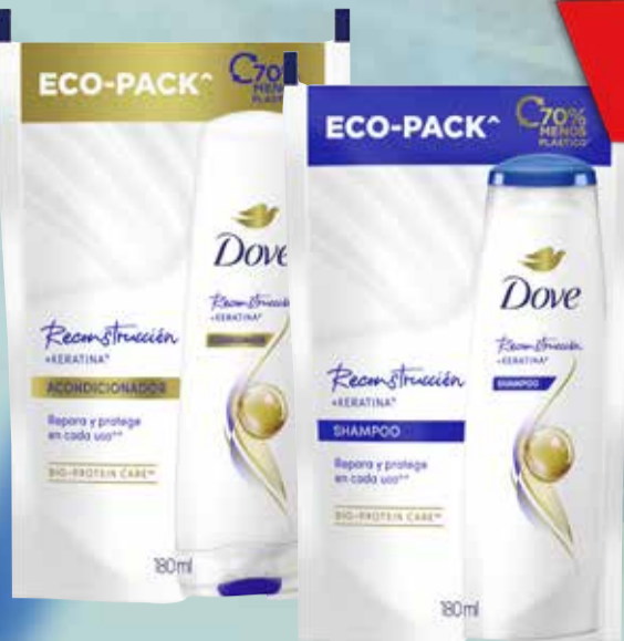
ACO/SHAMPOO DOVE 180ml d/p

Pcio.x kg/l: 13332,78 Cod: 24183-24182-25717-25718