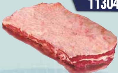
ASADO TF CARNES PLANCHA X KG. Pcio.x kg/l: 11899,90 Cod: 28219