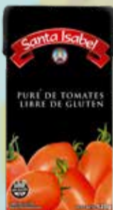
PURE DE TOMATES SANTA ISABEL X 520 Grs Pcio.x kg/l: 1095,96 Cod: 18932