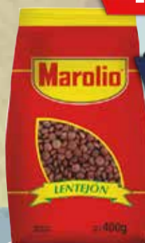
LENTEJON MAROLIO X 400 Grs Pcio.x kg/l: 4249,75 Cod: 24376

Y ADEMÁS TE DEVOLVEMOS 145,98 EN MAXI VOUCHER