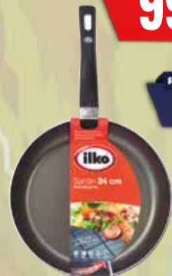
SARTEN ILKO 24cm Pcio.x kg/l: Cod: 17963