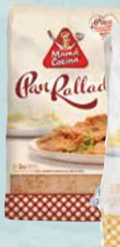
PAN RALLADO MAMA COCINA x1 kg Pcio.x kg/l: 1999,90 Cod: 17556-21436