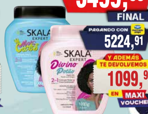
CREMA TRATAMIENTO SKALA 1kg

Pcio.x kg/l: 5499,90 Cod: 28626-28627-28628-28629-