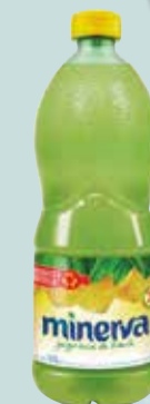
JUGO DE LIMÓN MINERVA x 1 lt. Pcio.x kg/l: 3799,90 Cod: 1257

Y ADEMÁS TE DEVOLVEMOS 339,98 EN MAXI VOUCHER