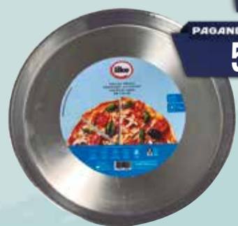
PIZZERA ILKO 34cm Pcio.x kg/l: Cod: 18315