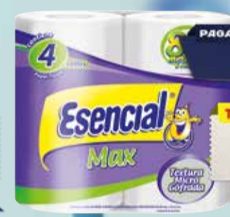
PAPEL HIGIENICO ESENCIAL 4x80mts Pcio.x kg/l: 8,44 Cod: 18602