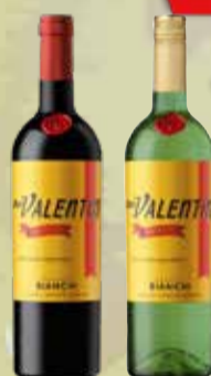
VINO DON VALENTIN LACR. TTO./BCO. x 750 cc Pcio.x kg/l: 4399,87 Cod: 2060-20459