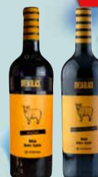
VINO OVEJA BLACK VARIETAL x 750 cc Pcio.x kg/l: 3999,87 Cod: 28430-28431