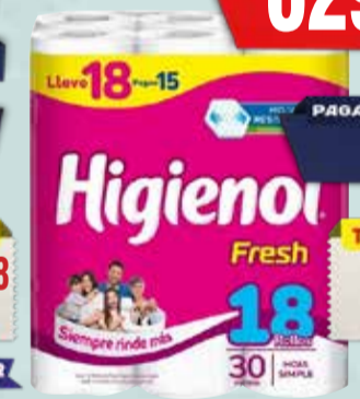
PAPEL HIGIENICO HIGIENOL fresh 18x30mts Pcio.x kg/l: 11,67 Cod: 23738