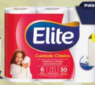
PAPEL HIGIENICO ELITE HS 6x30mts Pcio.x kg/l: 13,26 Cod: 15802