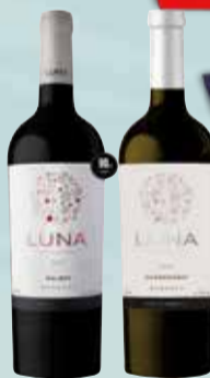
VINO LUNA VARIETALES x 750 cc Pcio.x kg/l: 3733,20 Cod: 28519-28520