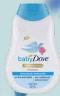
SHAMPOO DOVE baby 400ml