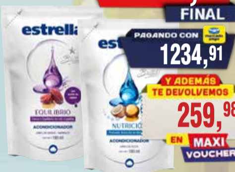
SHAMPOO Y ADONCIONADOR ESTRELLA D/P x 180 ml

Pcio.x kg/l: 7221,67 Cod: 28551-28549-28550-28554-