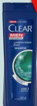
ACO/SHAMPOO CLEAR 200ml