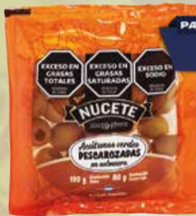
ACEITUNAS NUCETE VDE. DES. SAC 80 gr Pcio.x kg/l: 16248,75 Cod: 5989