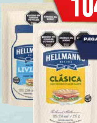
MAYONESA HELLMANN'S x 237 gr. Pcio.x kg/l: 4429,96 Cod: 1480-11664