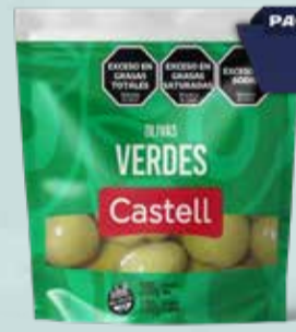
ACEITUNAS CASTELL VERDE 90 100 gr Pcio.x kg/l: 9999,00 Cod: 27236