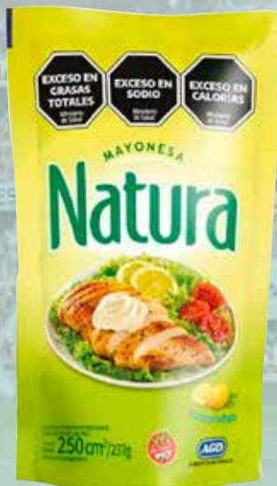
MAYONESA NATURA D/PACK X 250 Grs Pcio.x kg/l: 5399,60 Cod: 7274