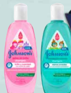
SHAMPOO J Y J KIDS x 200 ml

Pcio.x kg/l: 27499,50 Cod: 15081-17588-43153