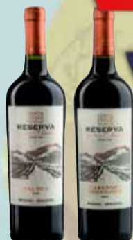
VINO RES.D.ANDES VARIETALES x 750 cc Pcio.x kg/l: 3066,53 Cod: 22079-22080