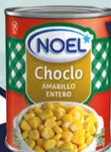
CHOCLO NOEL GRANO X 300 GR Pcio.x kg/l: 3666,33 Cod: 18429