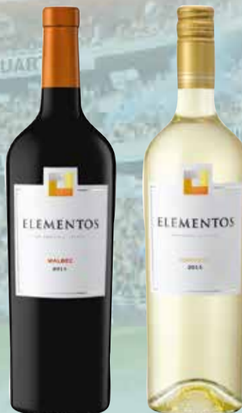
VINO ELEMENTOS VAR. x 750 cc Pcio.x kg/l: 4933,20 Cod: 13147-20110-20109-13143