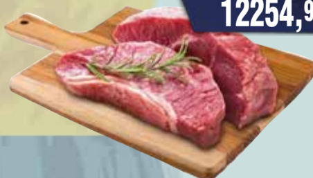
PALETA Y R. BEEF TF CARNES PORCIONADO X KG. Pcio.x kg/l: 12899,90 Cod: 28475-28477