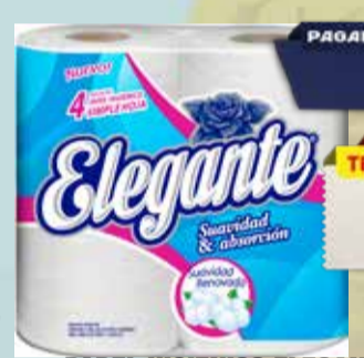
PAPEL HIGIENICO ELEGANTE HS 4x30mts Pcio.x kg/l: 11,67 Cod: 28765