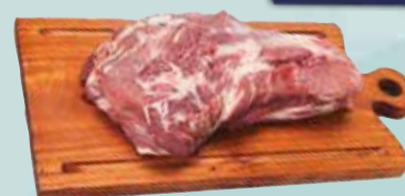
BONDIOLA DE CERDO X KG. Pcio.x kg/l: 7999,90 Cod: 24530-28234