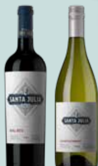
VINO STA. JULIA VARIETALES x750cc Pcio.x kg/l: 5733,20 Cod: 4173-15703-4174-4178-